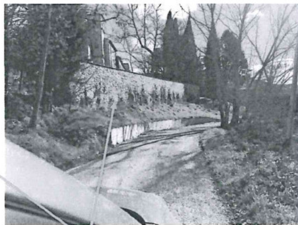
Muro di sostegno rivestito a seguito dell'autorizzazione MiBACT prot. 0002932 del 13.03.2018

Infine con nota 810-p del 23.06.2020 il Soprintendente "...rilevato che non è pervenuta nessuna relazione..." da parte del Comune di Luzzi, imponeva, inspiegabilmente, come correttivo, il ripristino dello stato dei luoghi e la parziale demolizione del muro di sostegno. Si precisa che in data 24.07.2020 il Comune di Luzzi, con nota 7420, nell'adempiere alla sopra richiamata prescrizione, ha trasmesso alla Soprintendenza Archeologica Belle Arti e Paesaggio la relazione annuale 2019-2020 corredata da documentazione fotografica.