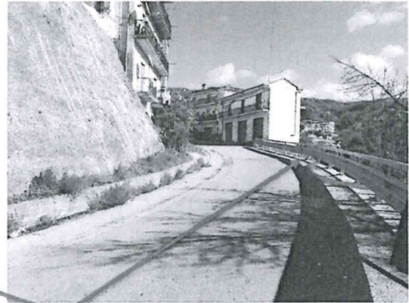
Opere oggetto del finanziamento

La frana, avvenuta presumibilmente nel 2021, interessa una porzione di terreno adiacente al sito oggetto dell'intervento ma non direttamente le opere realizzate. A seguito di informazioni assunte, per l'evento franoso il Comune di Luzzi ha avviato specifica procedura volta a mitigare il rischio; risulta in corso di perfezionamento la procedura di affidamento dei servizi tecnici di ingegneria per la redazione del progetto esecutivo.